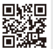
「DV相談+」ホームページ

電話やメール、チャットで相談することができます。電話とメールでの相談は、24時間いつでも相談を受け付けています。