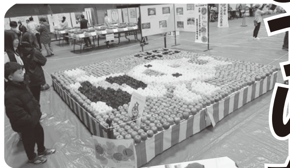
→ りんごアート ↓ ジャンボアップルパイ