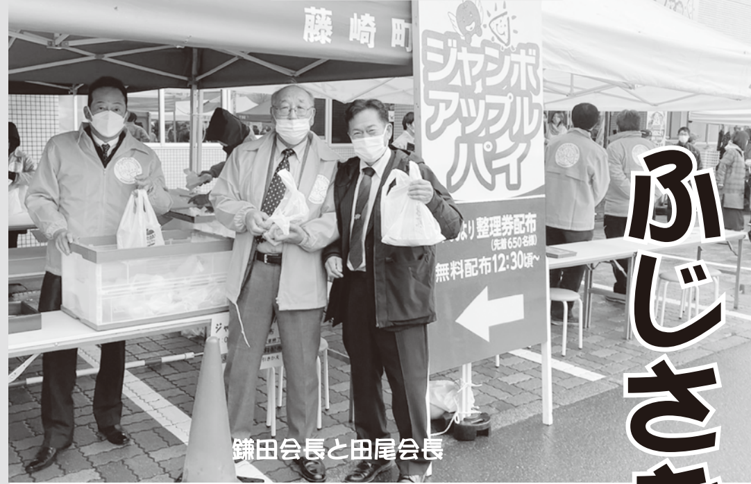
鎌田会長と田尾会長

紀宝町商工会では県内や近隣地域の商工会だけでなく、石川県中能登町商工会、青森県藤崎町商工会と交流があります。