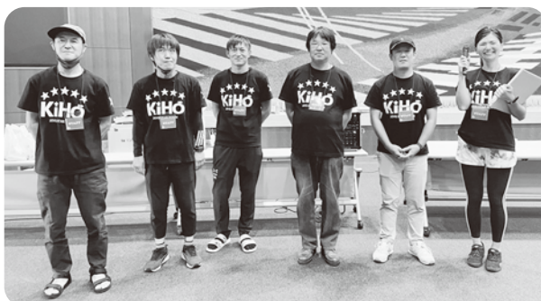
▲1対1のトークイベント (加工してあります) ▶協力した青年部の皆さん

今後も婚活イベントを実施予定とのことですので、少しでも興味を持たれた方は次回以降の参加お待ちしております！