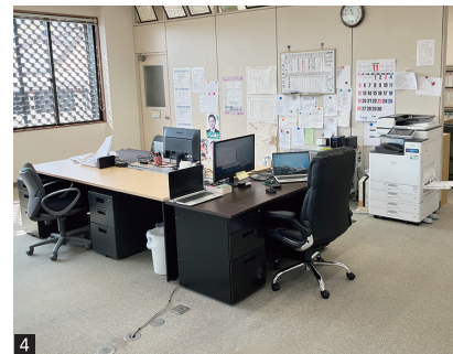
1.現場事務所では進んで意見を出し合って綿密に打ち合わせ 2.自動追尾測量機器による測量作業 3.マシンガイダンス(ICT施工対応)型の自社バックホーを駆使して生産性を向上 4.内外装をリノベーションし、より居心地よくなった井田営業所