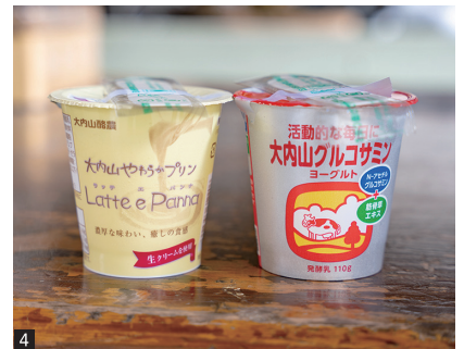
1. たっぶり詰まった生乳を機械で牛の負担なく搾り、大内山牛乳に供給 2. 畜産ならではの車両や重機のメンテナンスも重要な仕事 3. 事務管理作業も重要な業務 4. おなじみの牛乳のほか、プリンやヨーグルトなど新製品も続々登場中